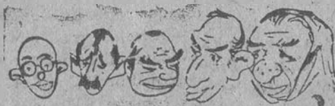
Representantes de la Línea de Fuego.

—Ofrecemos a nuestro público lector, para muy pronto, el "cliché," de un simpático amigo nuestro, corrector de pruebas de la Imprenta Nacional, a quien por su talle gentil y su excesivo garbo, llamamos algunos de sus amigos, de manera cariñosa, cuando no "Lindura," "Belleza," El "cliché" de Lindura irá acompañado de amena croniquilla.