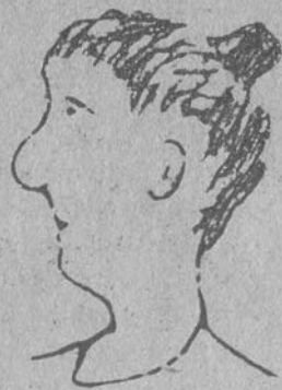
Una amiga de Yáñez

La mejor "tijera" es la mía, conste así; yo sé por qué lo digo.