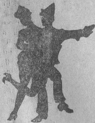
Una pareja del club "Ratoncitos Bodegueros"